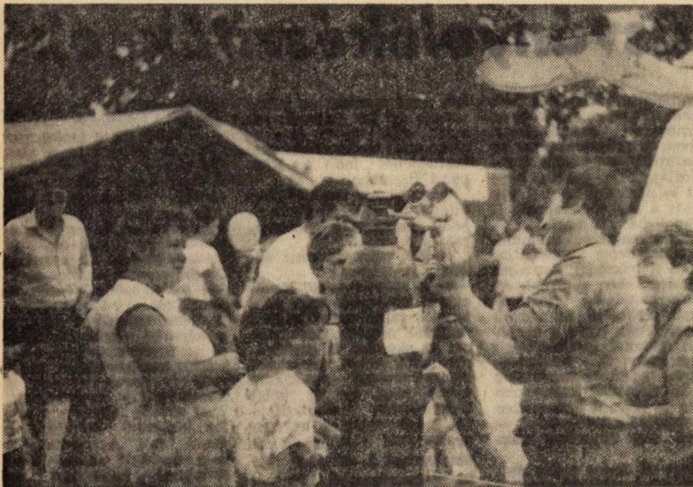
Kell a lufi

Kicsit paradox a helyzet, ha belegondolunk, hogy a század elejétől már komoly termelést produkáló bánya volt Alberttelepen, az ötvenes években pedig személynevezésként is nagy volumenű termelés folyt itt. A munkaverseny-mozgalmak idején itt döntözték meg a 100–200–300 százalékokat egyetlen élenjáró bányászember szavára.