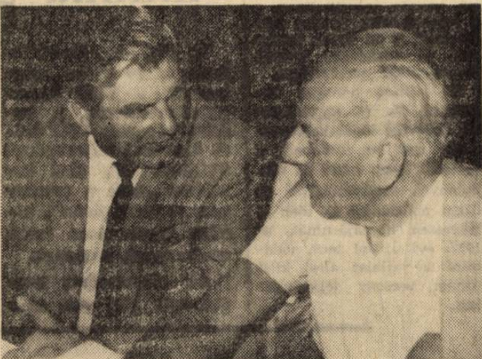
Eszmeesere a borsodi bányászat helyzetéről